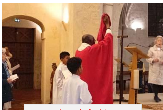
Le vendredi saint